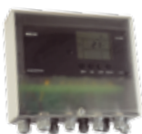
Automatikk EBC 20